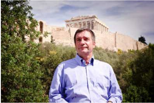
Yiorgos KAMINIS © City of Athens