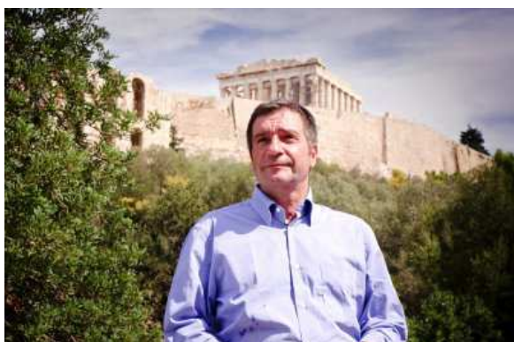
Yiorgos KAMINIS