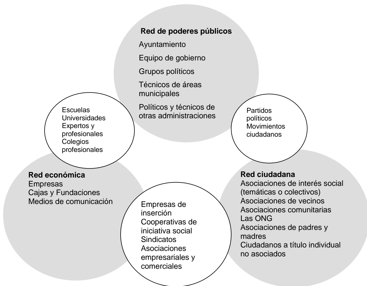
Figura 3. Red de actores para la inclusión social en el territorio