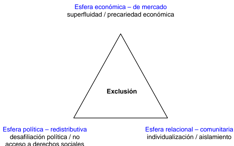
Figura 1. Exclusión y esferas vitales