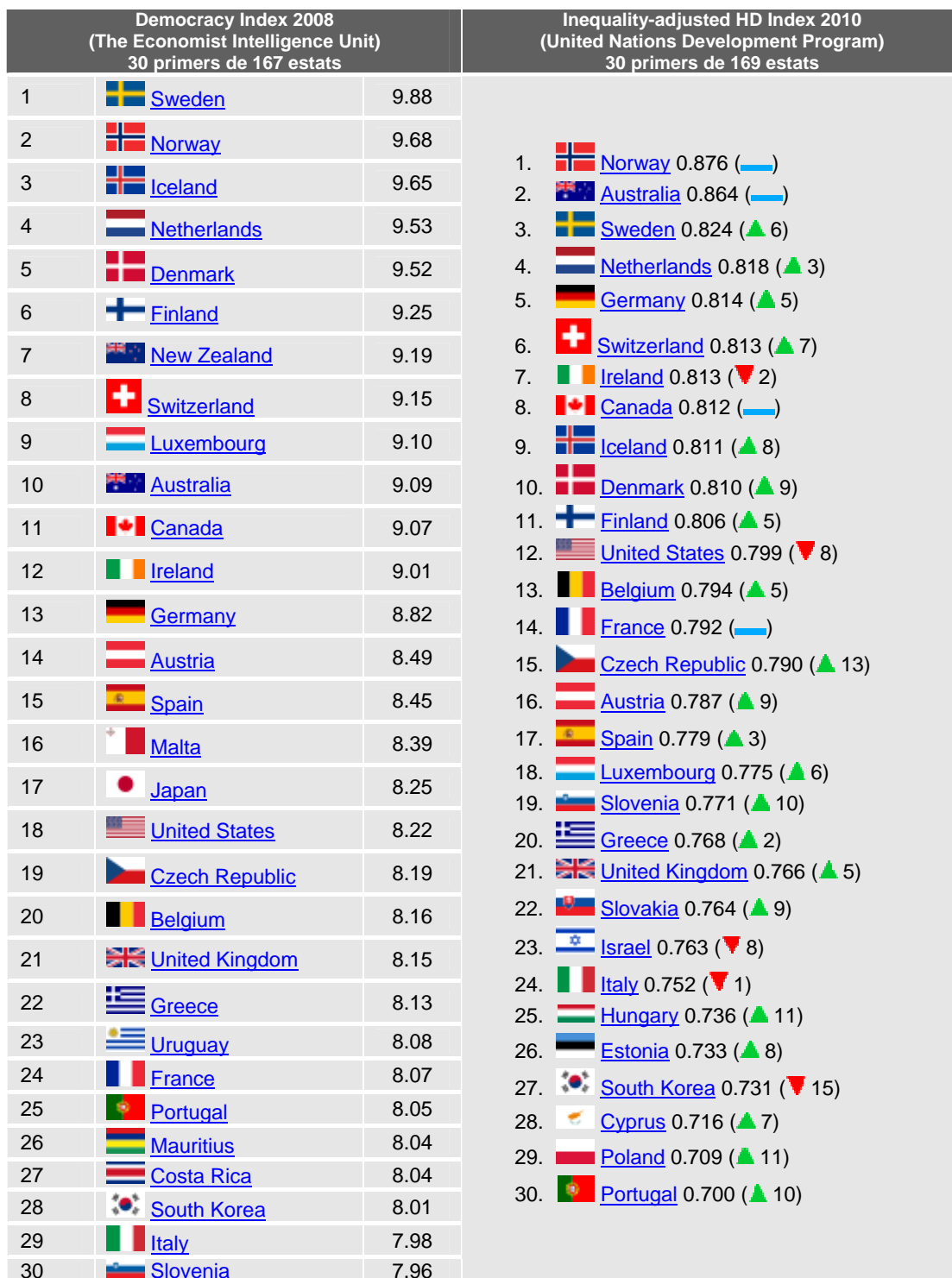
Tabla 4: Comparativa entre DI 2008 y IDH 2010 ajustado (30 primeros)