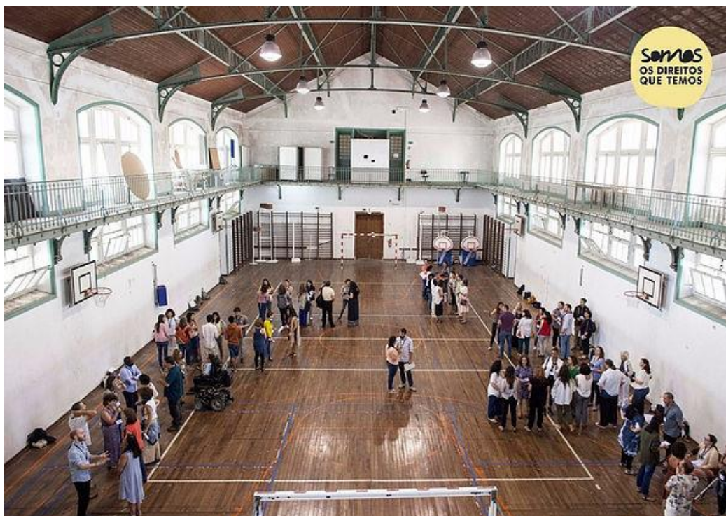
Image 2 - Une session conjointe de l'école SOMOS III, à l'école secondaire de Camões, en juillet 2017.