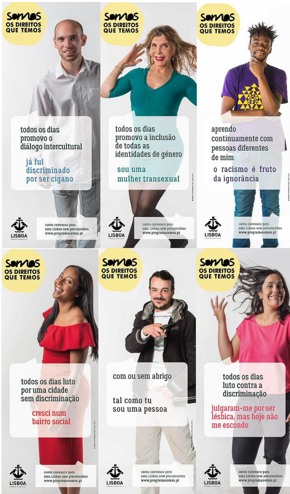
Figura 3 – Imágenes de la campaña “SOMOS os Direitos que Temos”. En SOMOS, n.d. Último acceso: 12 de julio de 2017, en http://www.programasomos.pt/a-campanha . Copyright 2017, derechos de autor del Ayuntamiento de Lisboa. Reproducido con su permiso.