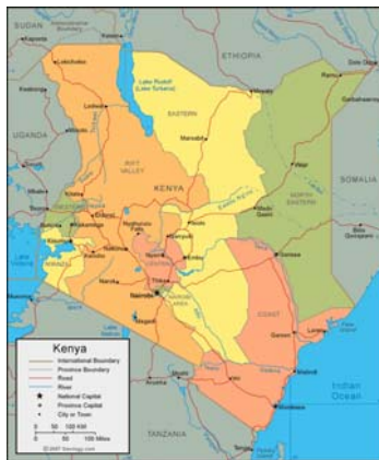
Figura 1: Mapa de las provincias de Kenia y la ubicación de Eldoret

El gobierno local de Kenia se lleva a cabo a través de las autoridades locales. Muchos centros urbanos albergan consejos de ciudad, de municipio o de pueblo. En zonas locales, las autoridades locales se conocen con el nombre de consejos de condado . Los concejales locales se eligen a través de elecciones municipales, que tienen lugar junto con las elecciones municipales. Eldoret, el objeto de análisis en este caso, está gobernado por un consejo municipal.