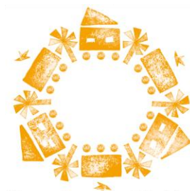
Global Platform for the Right to the City Plataforma Global por el Derecho a la Ciudad Plataforma Global pelo Direito à Cidade

La plataforma reúne organizaciones de la sociedad civil, gobiernos locales y centros de investigación con el objetivo de influenciar la adopción de compromisos, políticas públicas, proyectos y acciones para ciudades justas, democráticas, sostenibles e inclusivas. La Comisión de Inclusión Social, Democracia Participativa y Derechos Humanos es co-fundadora de esta plataforma, y participa en los grupos de trabajo de «Incidencia Política» y «Comunicación» .